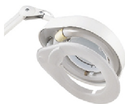
ochranný kryt zářivky